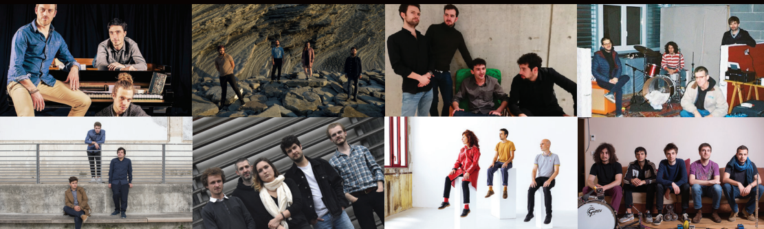
EXTRA - TREMPLIN RÉZZO JAZZ À VIENNE