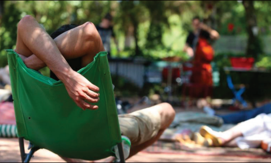
JOURNÉE JEUNE PUBLIC