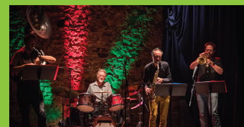
Jeuselou du Dimanche