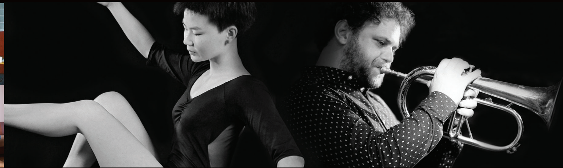
EXTRA - SOIRÉE JAZZ - BEAUMONT

Dès 13h / LA BAIE DES SINGES - COURNON D'AUVERGNE