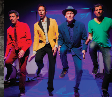
JOURNÉE JEUNE PUBLIC