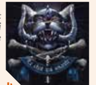
Le Chat qui miaule