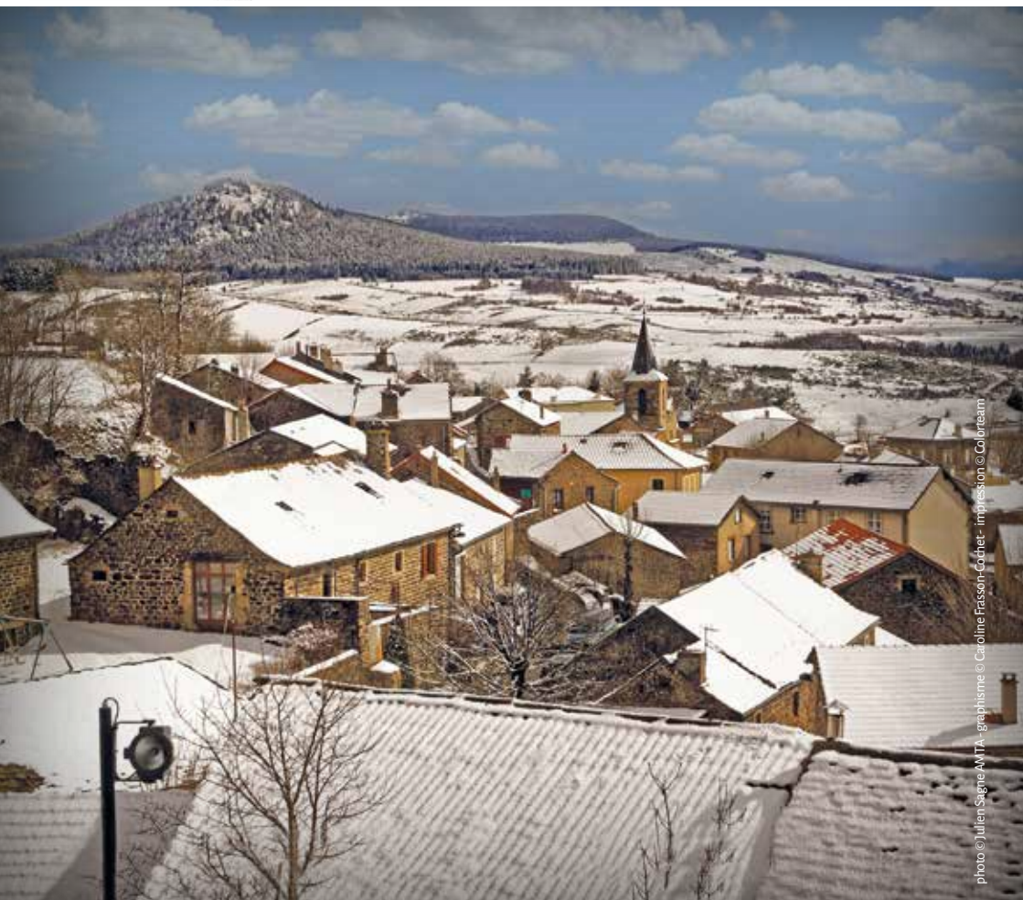
graphisme © Caroline Fassin-Cochet - impression © Colibrisam