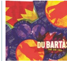
Du Bartàs Tant que Vira...

Disponible sur : www.auvergnediffusion.fr, 04 73 63 03 39