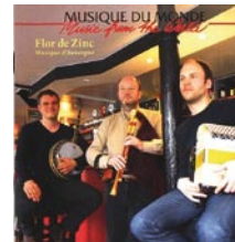
Flor de Zinc Musiques d'Auvergne

Disponible sur : www.auvergnediffusion.fr, 04 73 63 03 39