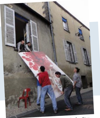
Bouscatel passant par la fenêtre... Peinture de Patrick Bouffard.

04 70 90 12 67, cultures-traditions@wanadoo.fr, www.cultures-traditions.org